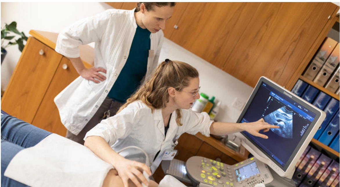
Une étudiante qui débutera le master en septembre 2019 à Fribourg