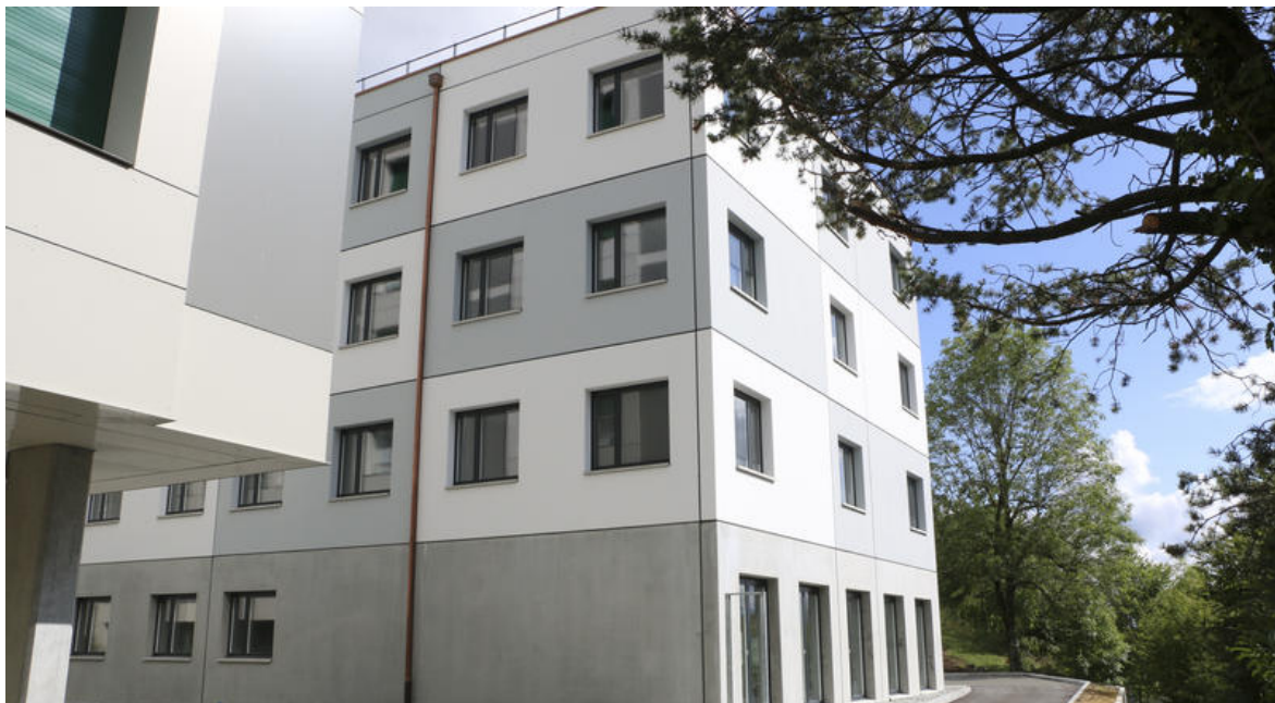
Le nouveau bâtiment du master en médecine

Le concept de formation clinique repose sur une approche participative : chaque tâche est discutée entre étudiants et formateurs. Cette démarche exerce un effet positif sur la qualité de l'enseignement clinique et représente une plus-value pour la filière de master à Fribourg.