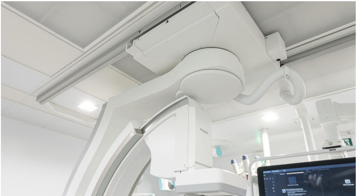
Plafond soufflant dans une salle d'intervention