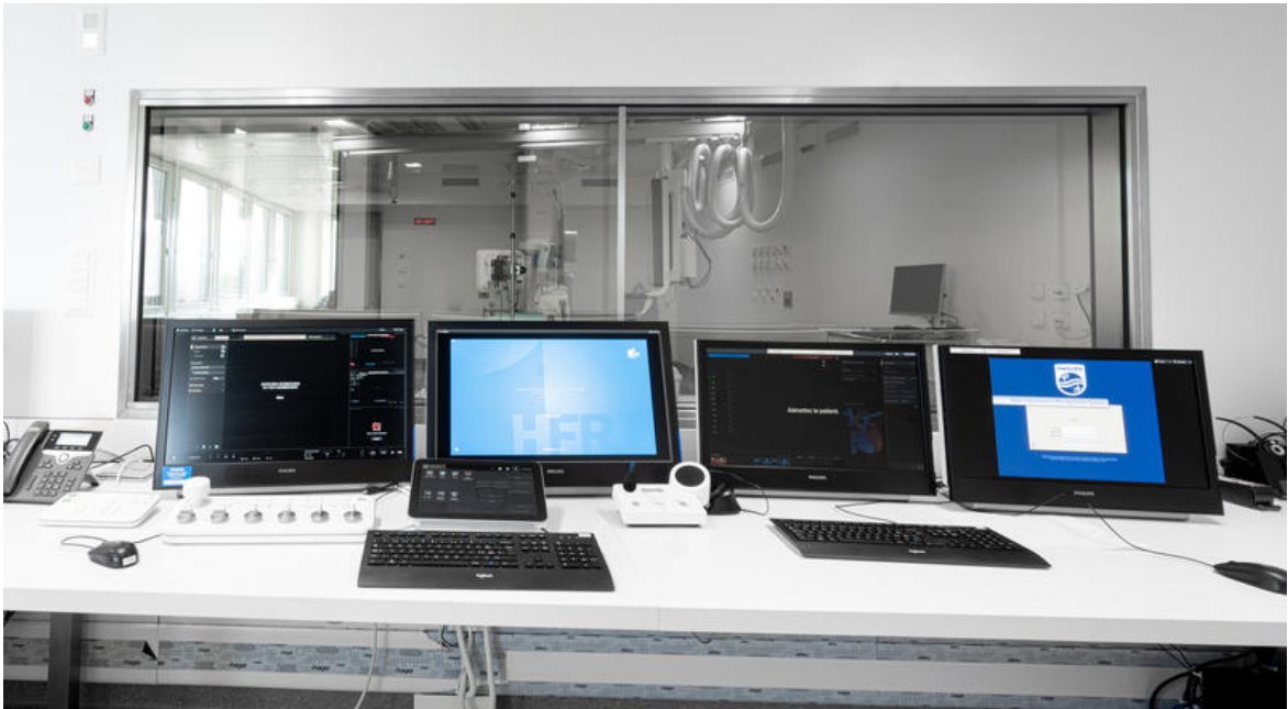
Salle de monitoring