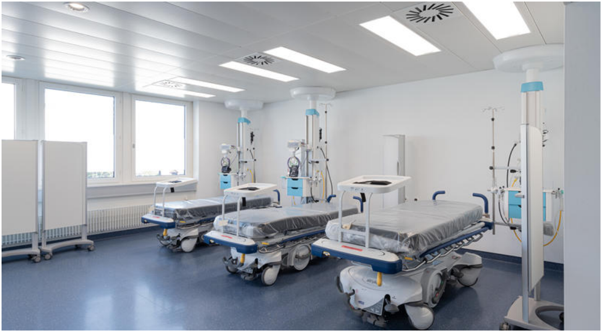
Hôpital de jour