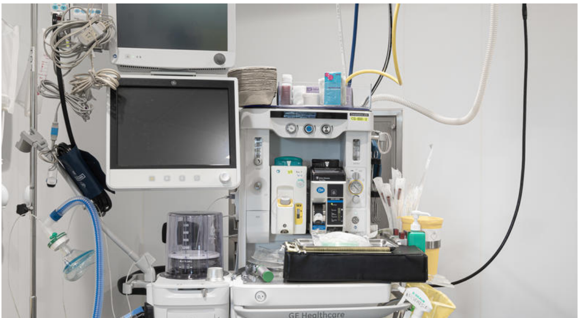
Salle de monitoring