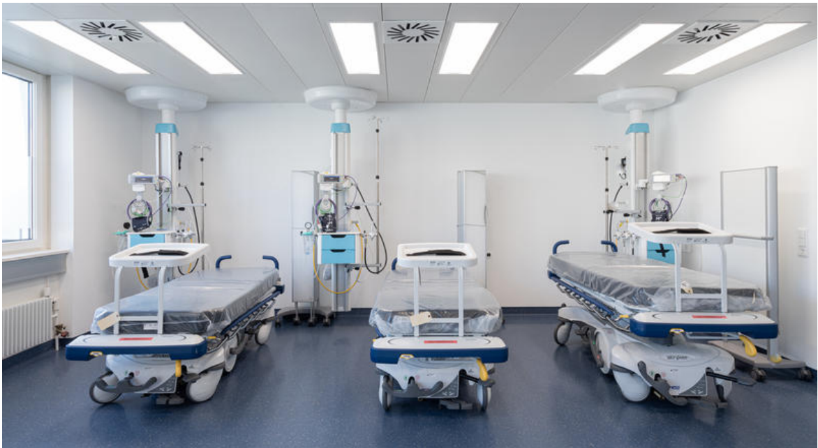
Hôpital de jour